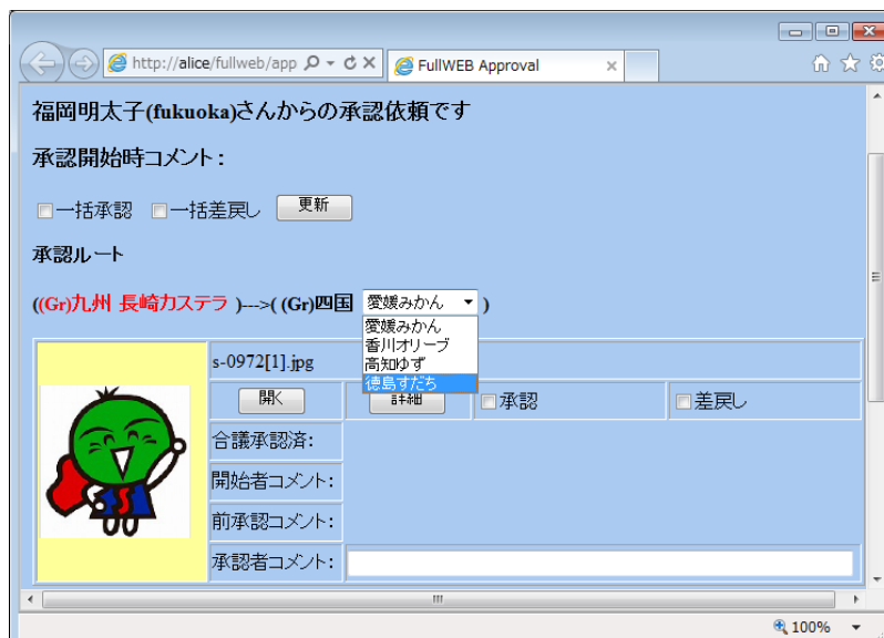
図 2 承認者である長崎カステラさんは次承認者を四国（愛媛、香川、高知、徳島）から選択可能